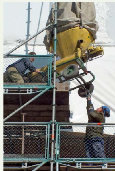
Veiligheid verbetert als je die niet alleen top down, maar zeker in de bouw ook bottom up aanpakt.