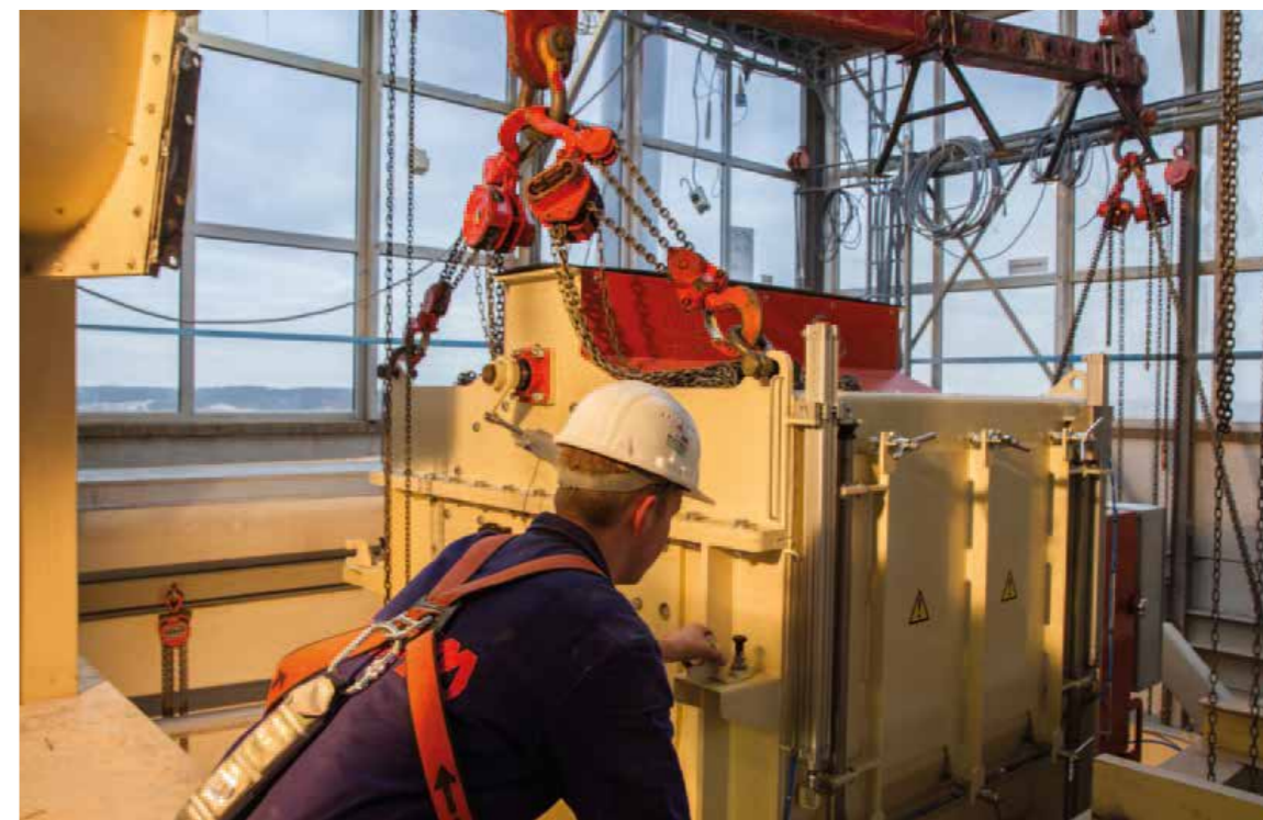
“Het uiteindelijke doel van Tagpoint is om daadwerkelijk minder ongelukken op de werkvloer te krijgen.”

Als ander voorbeeld haalt Vennik een bedrijf aan waar discussie was over het gebruik van een valhelm. “Wij laten in een module zien op welke manier de helm je beschermt en wat deze precies